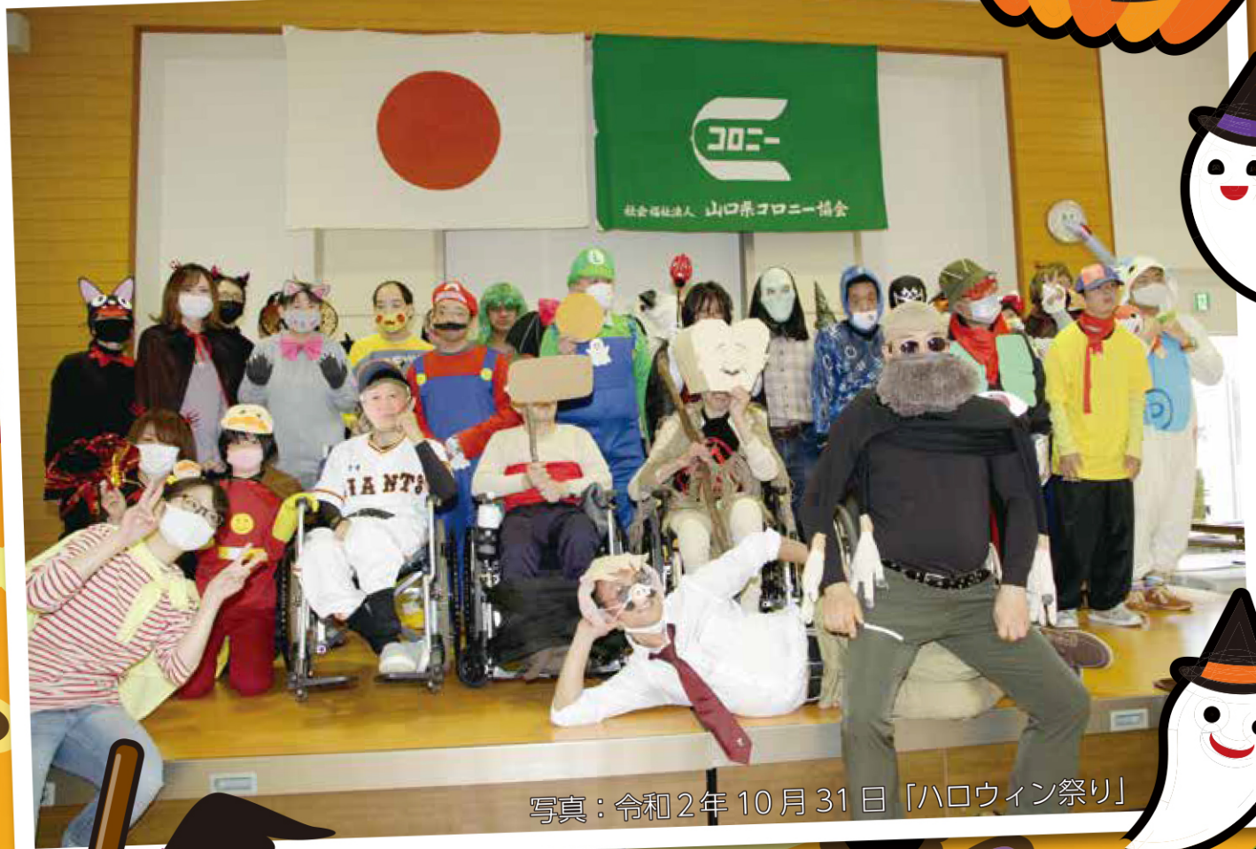
写真：令和2年10月31日「ハロウィン祭り」