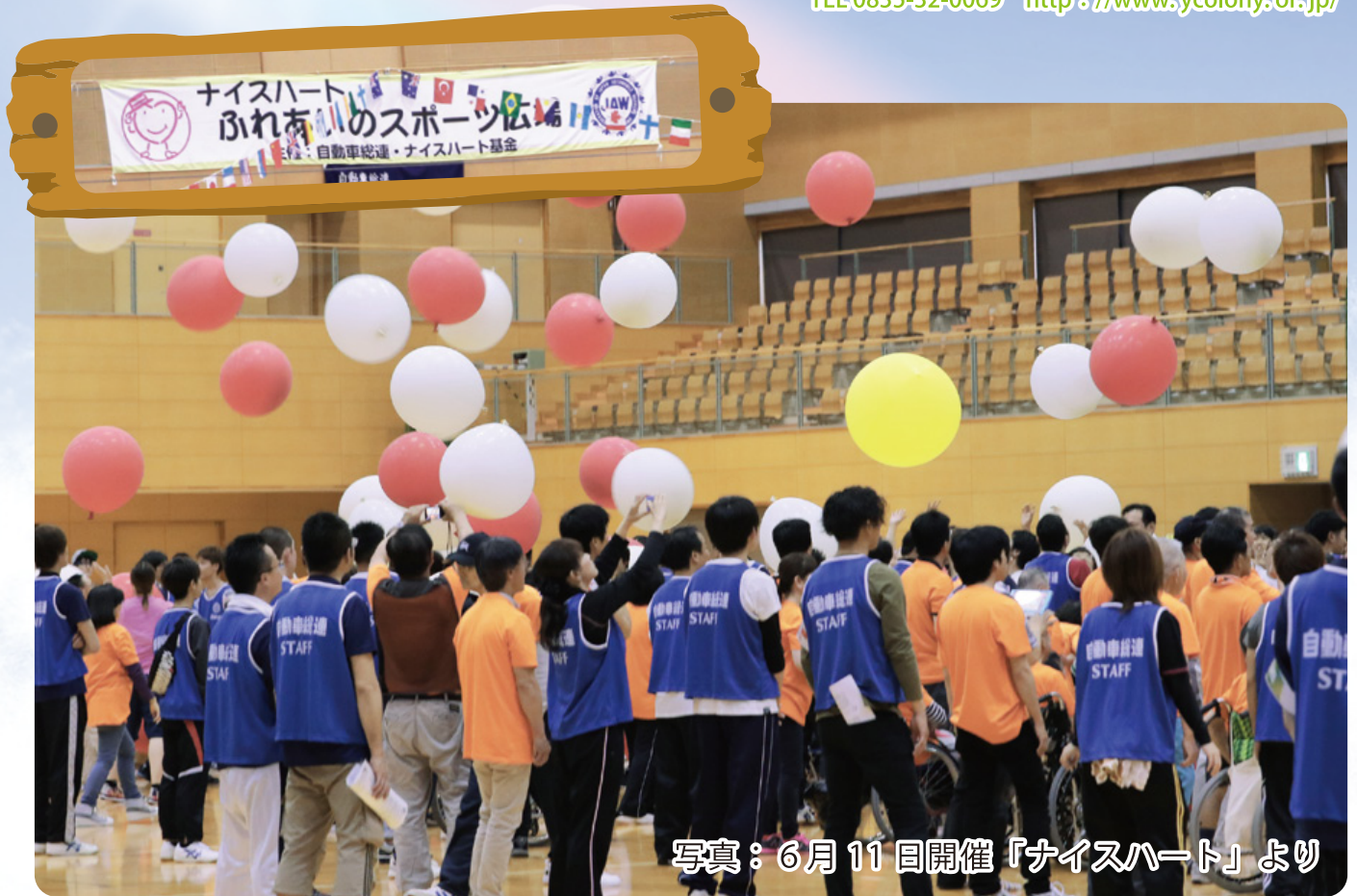
写真：6月11日開催「ナイスハート」より

発行/社会福祉法人 山口県コロニー協会 防府市台道 522 TEL 0835-32-0069 http://www.ycolony.or.jp/